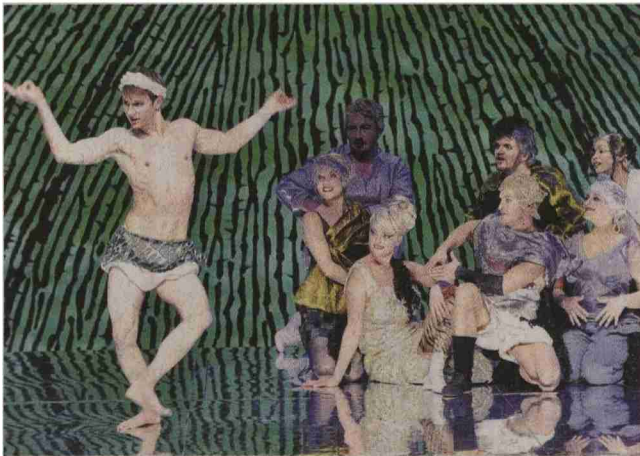
Shakespeares „Sommernachts- traum“ getanzt, gesungen und gespielt: Henry Purcells Semi-Opera „The Fairy Queen“ feierte in St. Gallen eine traumhafte Premiere.