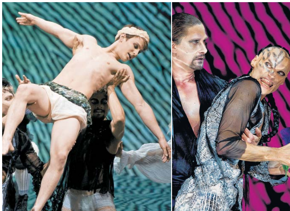
„The Fairy Queen“ von Henry Purcell, uraufgeführt 1692 als „Semi-Oper“, ist eine Bearbeitung von Shakespeares „Ein Sommernachtstraum“.

➔ Nächste Aufführung am 13. März, 19.30 Uhr und weitere: www.theatersg.ch Dauer: 3 Stunden