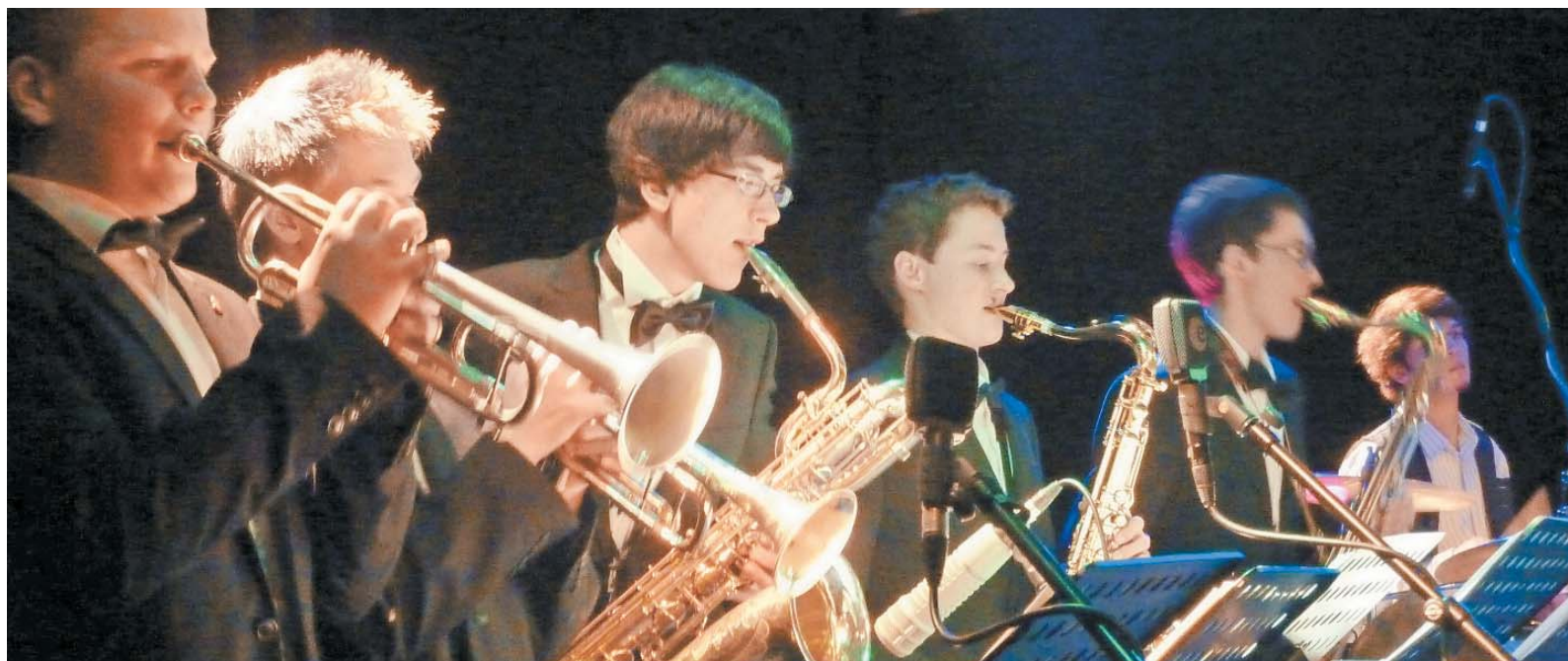
Als Formation ist Funk Factory bislang wenig bekannt, die Musiker haben jedoch das Zeug für eine Band, der man gute Chancen auf Erfolg nachsagen kann.